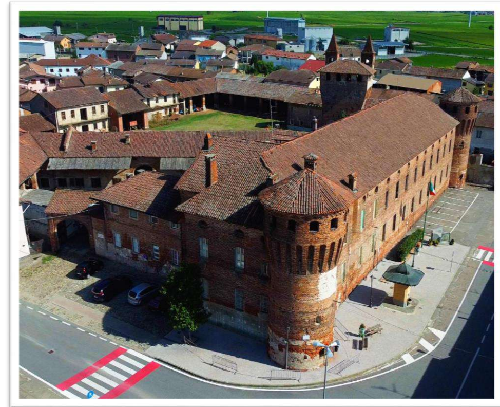
Il castello di Parolo, uno dei tanti beni storici dell'ASL VC

Recupero immobili di proprietà per nuova sede delle attività attualmente collocate in spazi affittati (es. riqualificazione palazzina ingresso ex OPN)