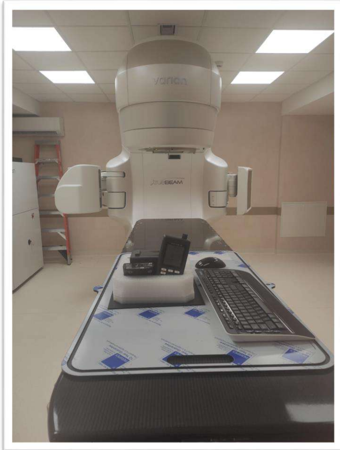
Acceleratore lineare di Quadrante per la Radioterapia di Vercelli