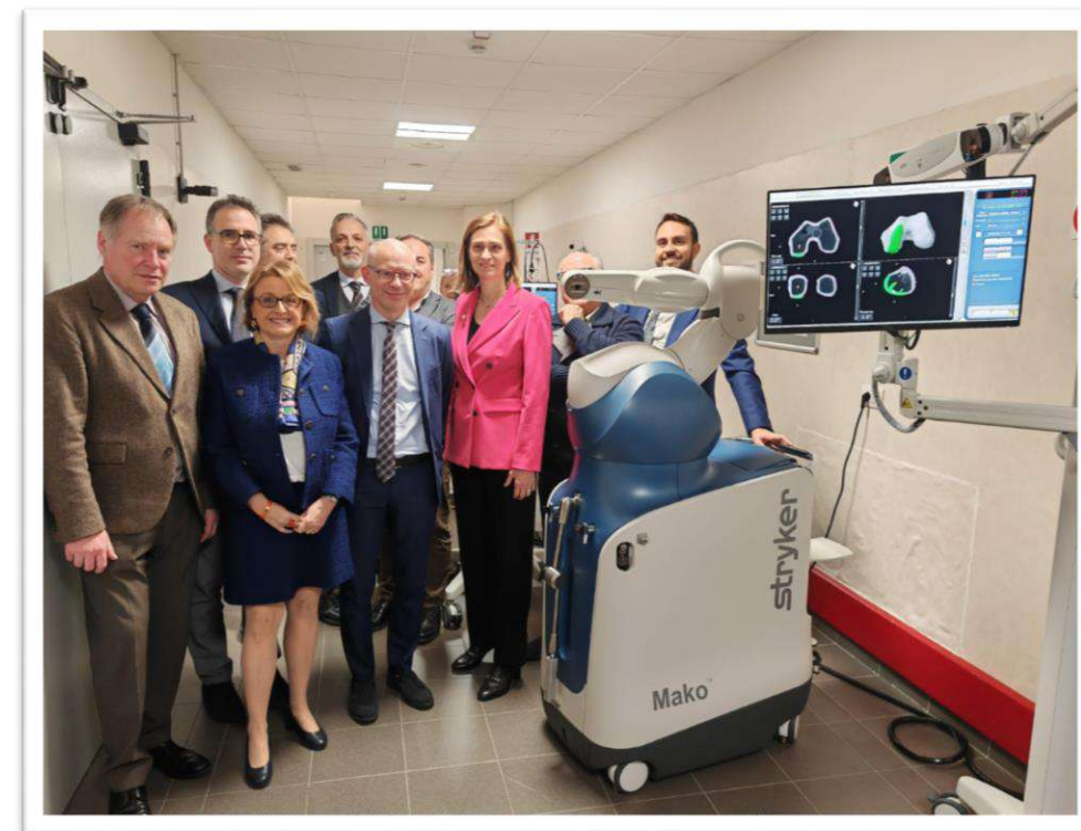
Il robot ortopedico in dotazione all'ospedale di Borgosesia, l'unico di questo tipo in Piemonte

Dal 2023 l'ospedale Sant'Andrea è accreditato da Unicef «Ospedale amico del bambino» .