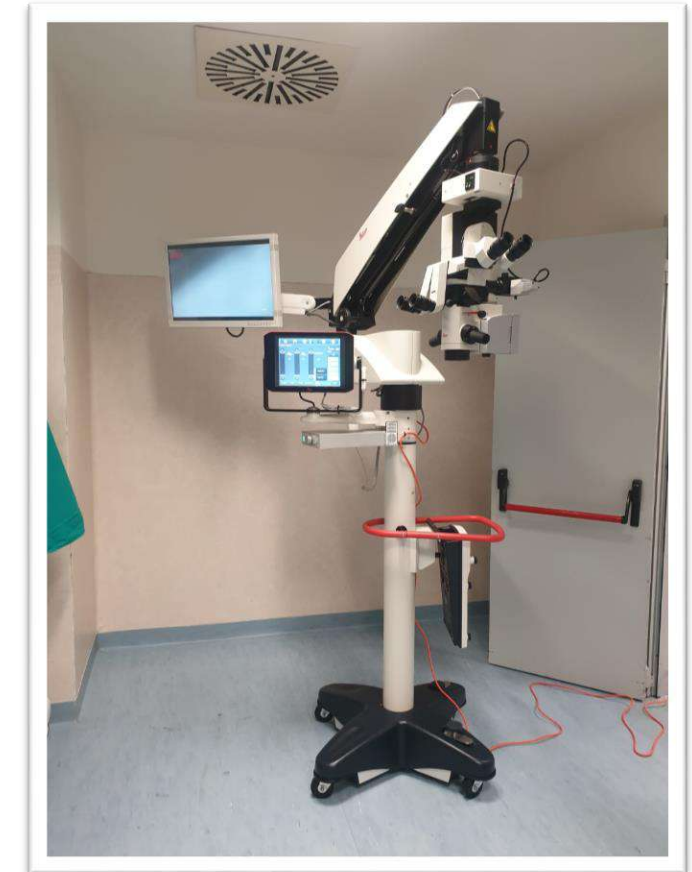
Microscopio oftalmico donato da Igea e Fondazione Valsesia per le operazioni di cataratta a Borgosesia